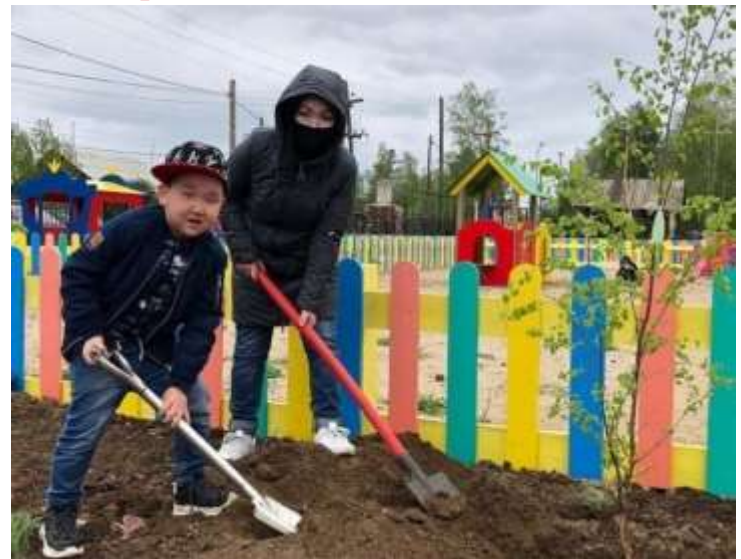
Начало «Аллеи выпускников»