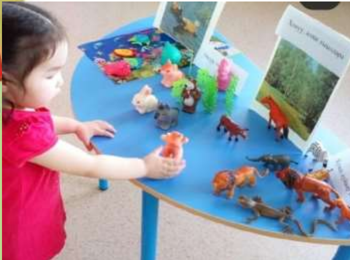
Игра у самых маленьких «Где кто живет?»