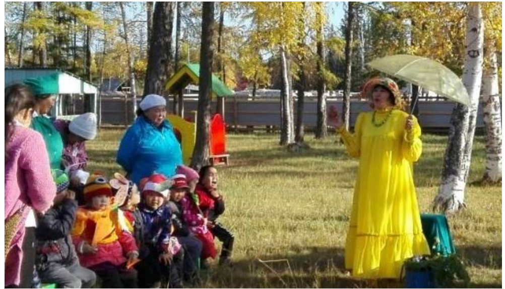
Праздник «Золотая осень»