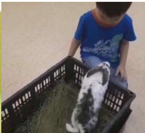
Самый интересный «гость»