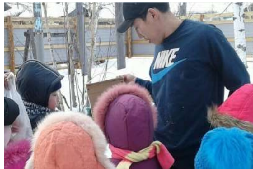
Клуб оцов и мужчин родни «Күнү кытта сырсабыт» проводит День птиц.