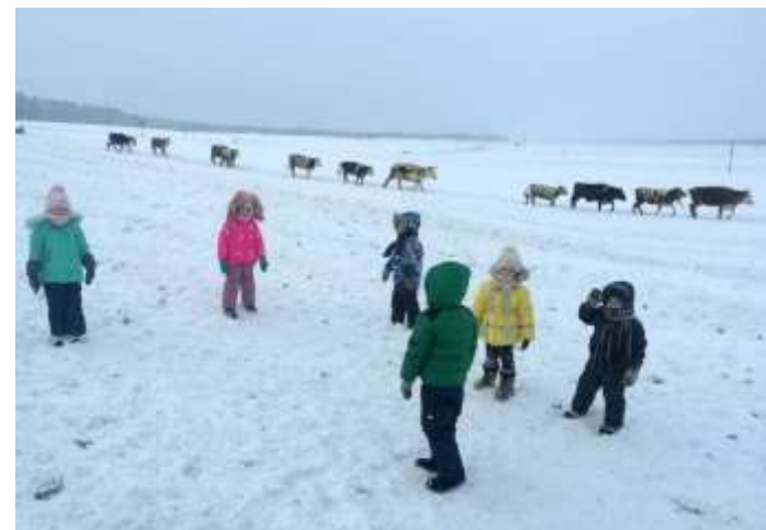
Экскурсия в проруби для водопоя скота